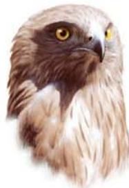
Águila culebrera Circaetus gallicus

Las numerosas oquedades y refugios que ofrecen las paredes rocosas de la mina, ejercen de reclamo para la fauna del entorno, especialmente para las aves y entre estas, las que se instalan con mayor asiduidad son las rupícolas , siendo la grajilla ( Corvus monedula ) el ave nidificante más próspera, junto con el estornino negro ( Sturnus unicolors ), la chova piquirroja ( Pyrrhocorax pyrrhocorax ), y el avión roquero ( Ptyonoprogne rupestris ), entre otras especies. Pero el señor de este lugar es el búho real ( Bubo bubo ) que también nidifica y la culebrera europea ( Circaetus gallicus ), así como ocasionalmente lo hace la otra joya alada de este espacio: la cigüeña negra ( Ciconia nigra ).