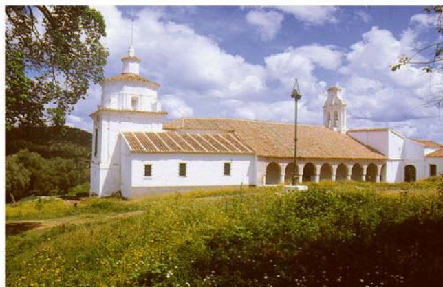
Ermita Virgen del Ara.

Partiendo desde la mina por una senda que asciende a la cima de la Sierra de La Jayona, desde donde se puede contemplar una espectacular panorámica de este paisaje serrano, se desciende la loma siguiendo el sendero entre olivares y matorrales propios del Monte Mediterráneo hasta llegar a la ermita de la Virgen del Ara , construida en 1494 y declarada Bien de Interés Cultural. Tras contemplar las pinturas que decoran paredes y bóveda de esta "Capilla Sixtina rural" y el descanso que favorece este pintoresco lugar, continuaremos por el camino que une la ermita a la carretera de Fuente del Arco a Puebla del Maestre que pasa