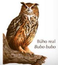
Búho real Bubo bubo