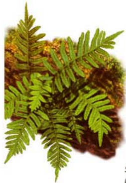
Polipodio Polypodium vulgare

El conjunto del paisaje que rodea la mina de la Jayona corresponde al ecosistema de Monte Mediterráneo donde la encina ( Quercus rotundifolia ) es la especie arbórea más característica de estas serranías, acompañada de piruéтанos ( Pyrus bourgaeana ), quejigos ( Quercus faginea ), acebuches ( Olea europaea silvestris ), y en las riberas con fresnos ( Fraxinus angustifolia ), sauces ( Salix sp. ) junto con adelfas ( Nerium oleander ).