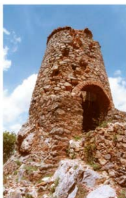
Chimenea del fogón.

Desde la estación de ferrocarril de Fuente del Arco se puede acceder a la antigua fundición de hierro derruida, con restos arqueológico-industriales de la pasada actividad minera, desde la que parte un túnel de conducción de humos, que a escasos metros se convierte en un callejón. Siguiendo esta conducción o un estrecho camino paralelo, se sube hasta la fuente del Cura y la fuente del Valle, terminando en el cerro del Fogón, donde se encuentra la chimenea construida al