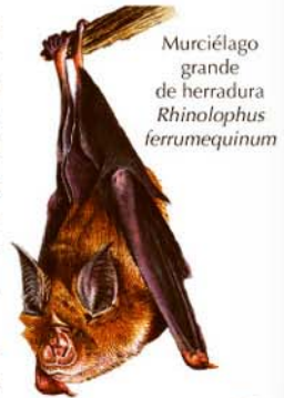
Murciélagos grande de herradura Rhinolophus ferrumequinum

También los reptiles cuentan con una nutrida presencia, tales como el lagarto ocelado ( Lacerta lepida ), así como varias especies de lagartijas y culebras , y otros reptiles propios de ecosistema del Monte Mediterráneo .