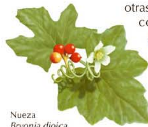
Nueza Bryonia dioica

Las especiales características ambientales (luz, humedad y temperatura) que se dan en el interior de la mina son las que favorecen un microclima muy particular, en claro contraste con las condiciones exteriores, y con ello la aparición de una vegetación propia de la flora rupícola , tales como el grupo de los helechos, representados por especies como el culantrillo ( Adiantum capillus-veneris ), el polipodio ( Polypodium vulgare ) creciendo en las paredes junto con