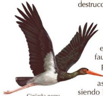
Cigüeña negra Ciconia nigra

otras especies de flora umbrófila tales como la fumaria , parietaria o geranio . Sin embargo, es la higuera ( Ficus carica ) la especie más visible por llegar en algunas zonas a formar bosquetes. La zarzamora , la nueza , la vid y un solitario almez también compiten en la colonización de este miniecosistema que, sin pretenderlo, nació de la destrucción hace apenas ochenta años.