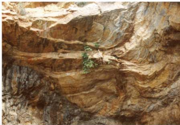
Pliegues en caliza.

En 1921, consecuencia de la menor demanda de mineral y de las revueltas sociales de la época, la explotación fue finalmente abandonada, quedando el hueco actual, del que se extrajeron más de 270.000 Tn de hierro y en el que llegaron a trabajar hasta 437 mineros que cobraban salarios de 2 pts./día los hombres y 1 pta./día las mujeres.