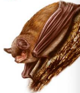
Murciélagos de cueva Miniopterus schreibersii