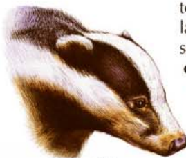
Tejón Meles meles

El roquero solitario ( Monticola solitarius ) también encuentra aquí su terreno propicio, sumándose a una larga lista de aves posibles de observar según las distintas estaciones: zorzales , cogujadas , colirrojos , escribanos , collalbas , lavanderas , currucas , mosquiteros , carboneros , herretillos , etc.