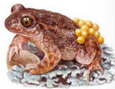
Sapo partero ibérico Alytes cisternasii