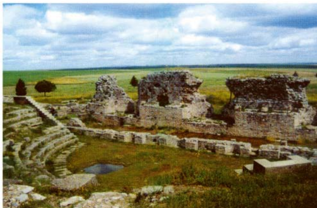
Teatro romano de Regina.

La ruta se puede completar con la visita a Azuaga y Berlanga pudiendo descansar en el Parque de esta población donde se pueden observar distintas especies de fauna silvestre en cautividad.