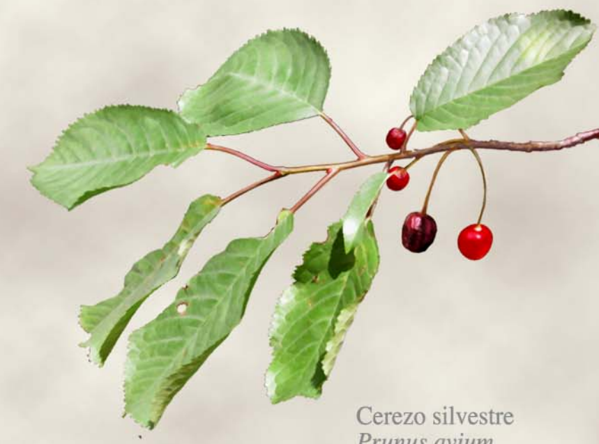
Cerezo silvestre Prunus avium