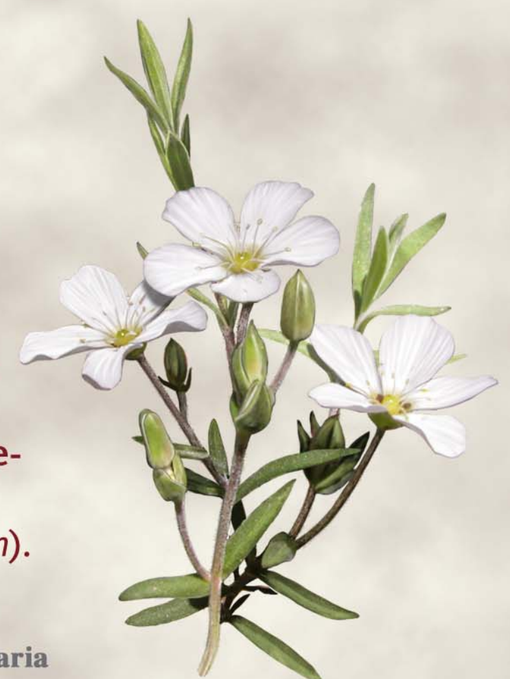
Arenaria Arenaria montana

Entre la numerosa flora de la zona destacan por su abundancia la arenaria ( Arenaria montana ), la orquídea manchada ( Orchis mascula ) y el helecho común ( Pteridium aquilinum ).