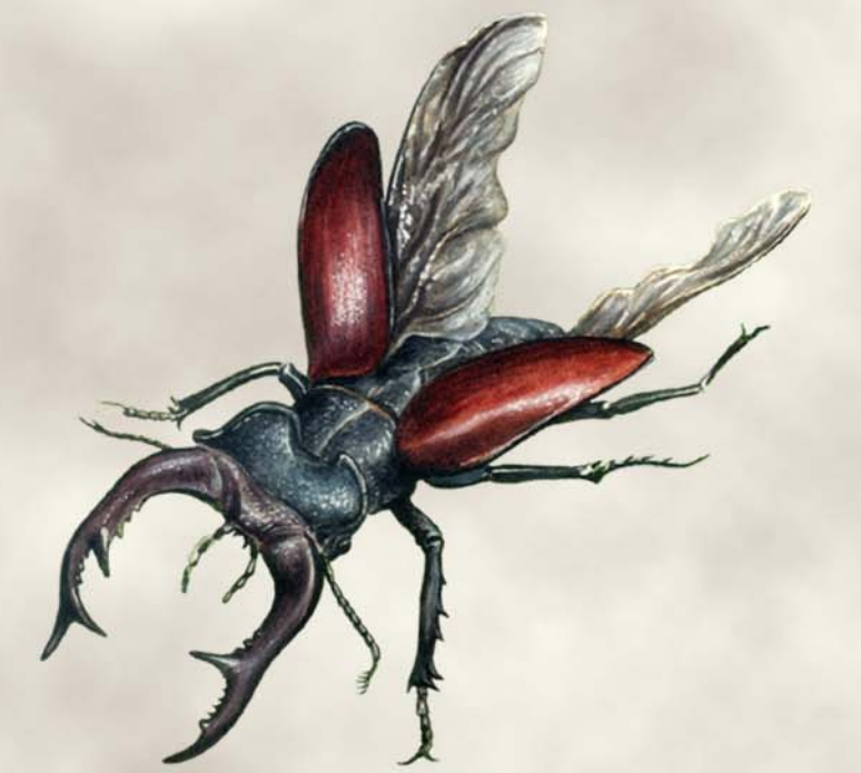
Ciervo volante Lucanus cervus

El entorno de la localidad de Barrado, a caballo entre La Vera y el Valle del Jerte, presenta una exuberante frondosidad que da lugar a una de las masas forestales mejor conservadas de la comarca. Los robledales de La Solana y de la Garganta del Obispo son de los mejor conservados de Extremadura. Aquí podemos encontrar especies propias de bosques bien conservados como el pico menor ( Dendrocopos minor ), el azor ( Accipiter gentilis ), el halcón abejero ( Pernis apivorus ), el murciélago ratonero forestal ( Myotis bechsteini ), el tejón ( Meles meles ) o el ciervo volante ( Lucanus cervus ).