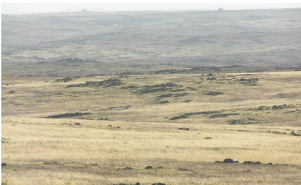
FOTO 6. Detalle de pastizal natural típico con afloramientos de pizarra o “dientes de perro” que se compensó por limitar el pastoreo en finca Linares.