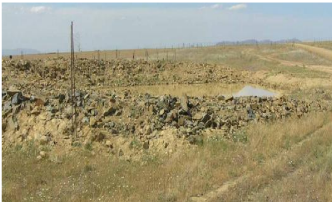
FOTO 9. Detalle de charca construida y reforestada.