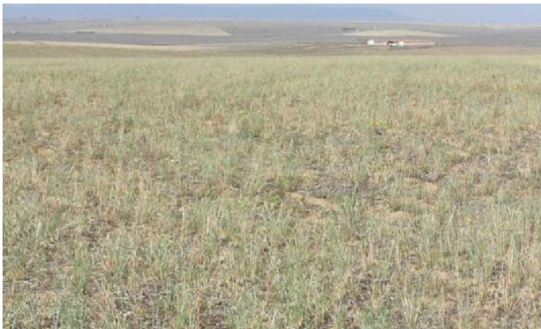
FOTO 7. Detalle de posío u hoja de labor en reposo, con restos de cosecha y vegetación herbácea y anual compensada por limitar su pastoreo.