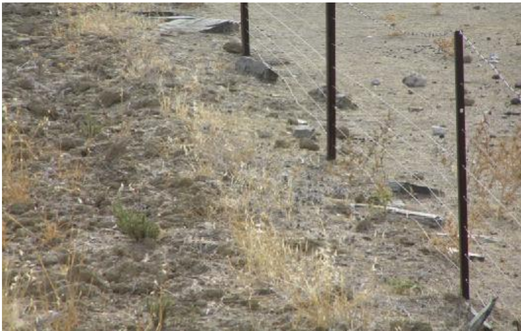
FOTO 8. Detalle de restauración de márgenes de parcela de cultivo en la finca Linares.