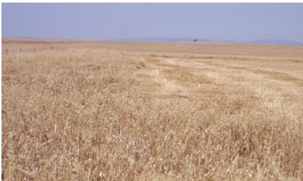
FOTO 2. Detalle de margen de cultivo de 4 a 5 metros de ancho de cereal sin cosechar.