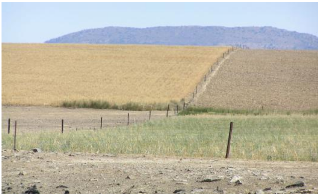
FOTO 5. Detalle de parcelas de cultivos: de izquierda a derecha parcela de rastrojo, parcela de barbecho labrado para sembrar en otoño, parcela de pastizal sobrepastoreado y parcelas siembra de cereal