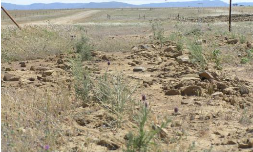
FOTO 7. Detalle de composición y distribución de plantas islas de matorral.