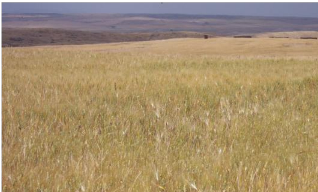
FOTO 1. Detalle parcela de cultivo con retraso de cosecha hasta el 1 de julio.