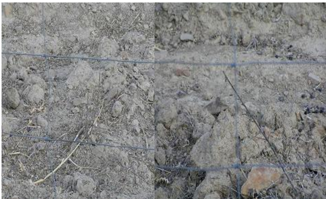
FOTO 12. Detalle del estado de las plantas tras ser aprovechada a diente por el ganado el cereal de la parcela de cultivo de la finca La Cebra.