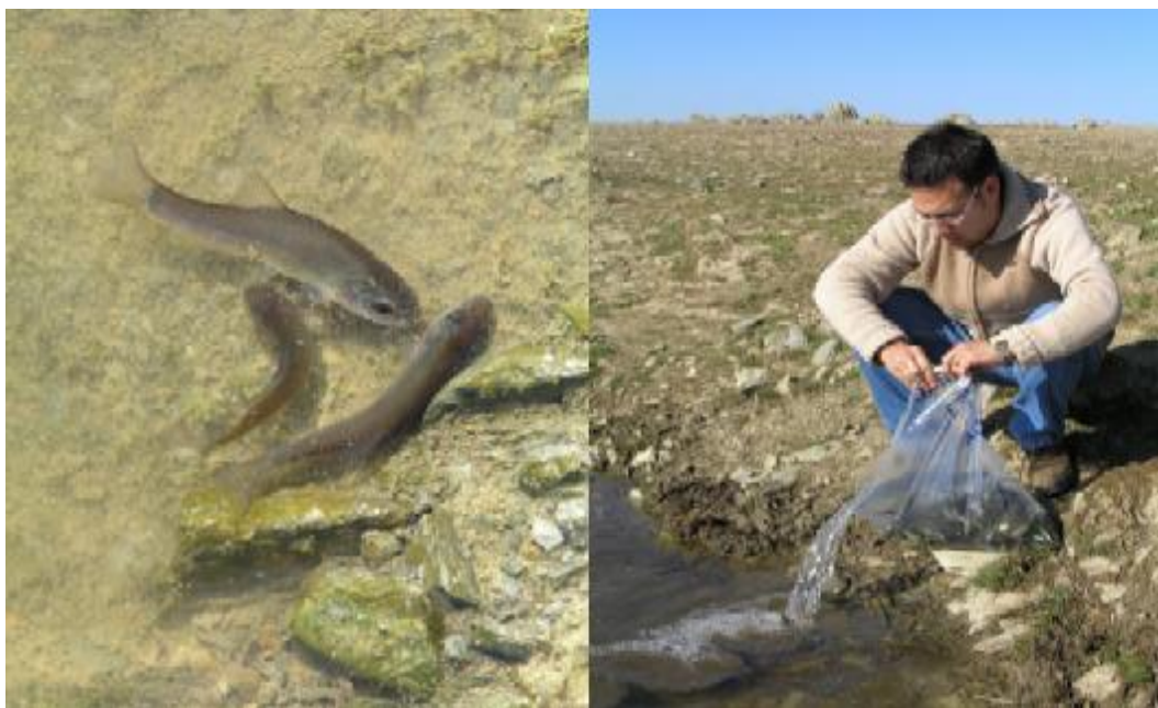
FOTO 10. Detalle de alevines de tenca empleados en la repoblación piscícola.