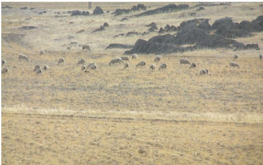
FOTO 11. Detalle de parcela de cultivo de cereal sin cosechar pastoreada por el ganado donde se han restaurado los márgenes de la parcela en finca Linares.