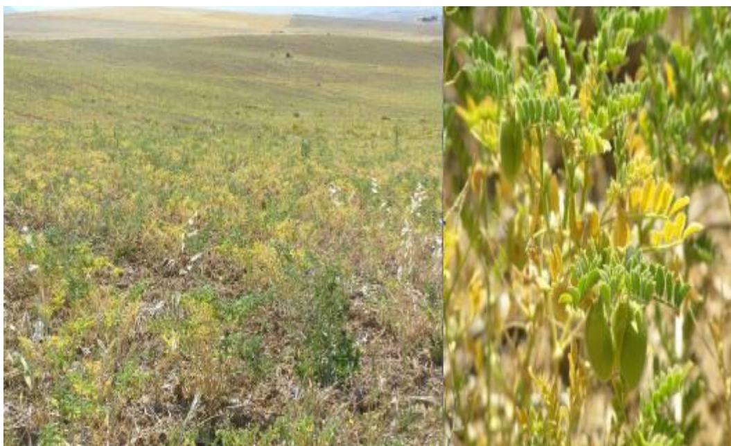
FOTO 4. Detalles de siembras de leguminosas primaverales (garbanzos).