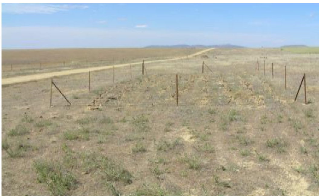
FOTO 6. Detalle de islas de matorral similares a las realizadas en la Finca La Cabra.