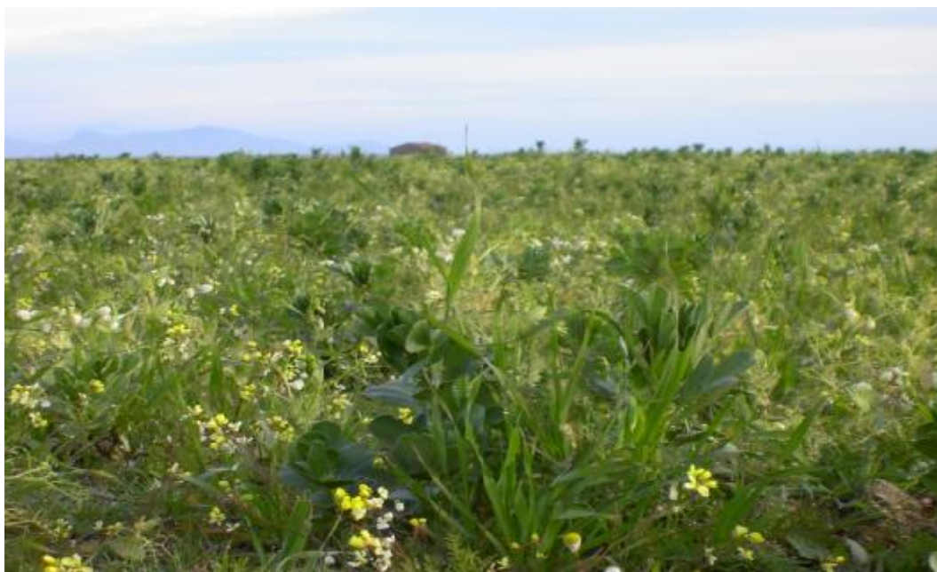
FOTO 3. Detalles de siembra de mezcla de leguminosas como habines, yeros, altramu, guisante y avenas y vezas.