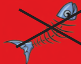
Restos de comida