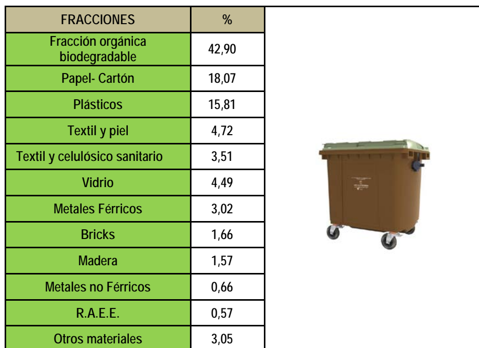
Tabla: Composición media de la fracción “resto” de los residuos urbanos generados en Extremadura.

Los resultados obtenidos en la caracterización de la fracción “resto” de residuos urbanos se presentan a continuación: